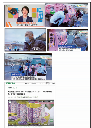
吉備ケーブルテレビ「パッカー車にラッピング」2023年1月23日放送