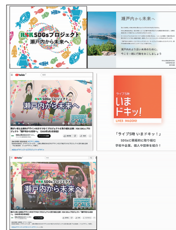
RSK SDGsプロジェクト 瀬戸内から未来へ 2023年3月2日放送