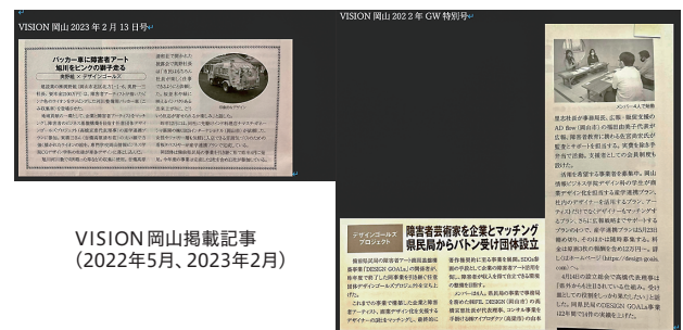
VISION岡山掲載記事（2022年5月、2023年2月）

り多くのクリエイターの方々に適正な報酬を得るためのサポートを継続するためには当プロジェクトのPRが必須となってきます。民間企業ではSDGsの取り組みも増えてきており、また、従業員教育の一環としてこの事業を活用される企業もあります。広報としては昨年、専用サイトの開設も完了し、SNSを中心とした広報PRを行っており、この度の事業実施で行った冊子（事例集）、チラシを活用し支援機関を始めとして就労支援事業所などへ配布を行ってまいります。