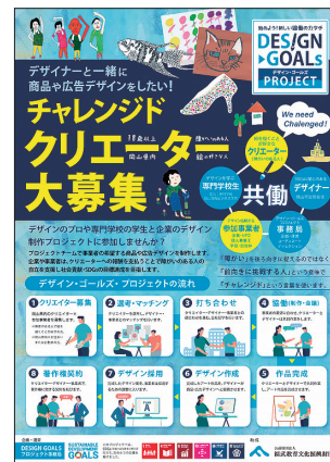
クリエイター募集チラシ

今後の課題としては、この事業を継続的に続けるためには団体の活動資金の調達が大きな課題となっています。よ