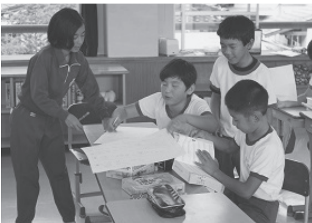
3 小学校合同授業 5年生 4校時国語