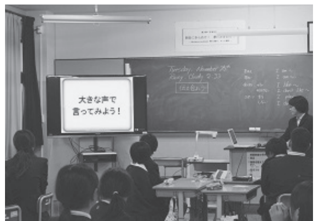
6年生合同授業(中学校) 6校時英語