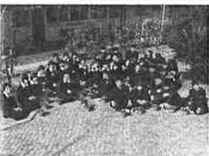
鉢と一緒に記念撮影

福田中学校は田んぼが広がる環境で、自宅が農家の生徒も多いそうです。しかし、自分の家でトマトを栽培している、とれぐらいで赤い実を付けるのには知りませんでした。だからこそ、栽培を通して生徒が発見することは多く、毎日興味をもって植物の成長を見守りました。