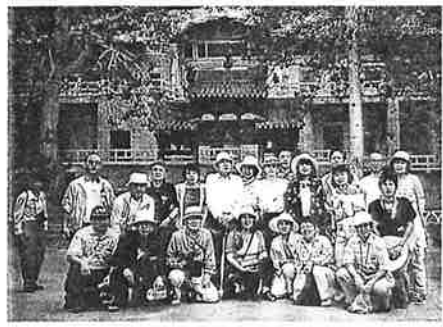
莫高窟の入口で記念撮影

を立ち、上海、西安を経て二四日敦煌に着いた。井上靖の小説を読み、映画「敦煌」の記憶もあり、更に五月のNHK衛星放送で莫高窟の中心まで見せてもらい、いやが上にも興味と関心をかき立てての敦煌入りであった。予想はしていたもの七月下旬は一年で最も暑い時期で早朝から30度を越える。西のかた陽関を出づれば故人無からん、と王维が詠んだ陽関まで75kmを冷房の利きの悪いバスで行く。陽関を見て帰りに敦煌古城へ寄った時気温37度。だが湿度45%で日陰に居ればしのげる。映画の