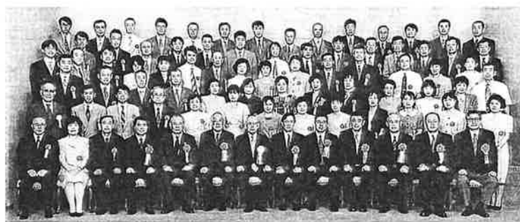
受賞者全員、来賓と一緒に記念撮影

は「教育研究助成」に含めることとし、図書館の図書、資料の充実を目的として従来実施していた「図書助成」を、要望に応じて復活させた。今後先生方の声を尊重しながら事業を展開していきたい。(岡田)