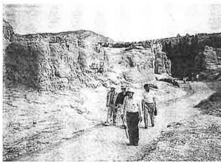
40°の炎天下で足もにぶりがち

軟臥の客室は四人同室でまず快適と言える。早朝吐魯番に着き、ベゼクリク千仏洞、孫吾空が活躍した火焰山を見学、アスターナ古墳では安らかな夫婦のミイラに合掌。次いで千五百年前の高昌城跡を