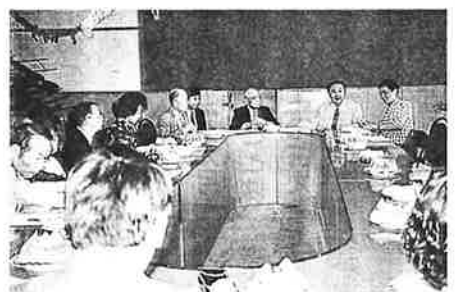
自治区教育委員会で情報交換

午後は人々の生命の基であるカレーズ(地下水)を見て前二世紀に建てられた交河古城に向かったがこれには参った。気温40度の中、だらだら坂を約1km登ると日陰も何もない一面の廃墟だ。同じ道を