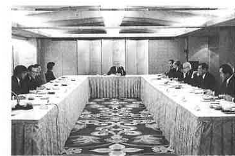
教育振興財団理事会