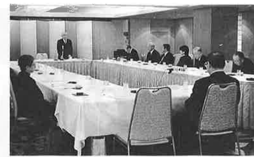
文化振興財団理事会

ア 教育・文化講演会 教育振興財団と共催で年間二回開催する。 イ 文化関係助成報告会 活動成果の共有と情報交換の場として開催する。